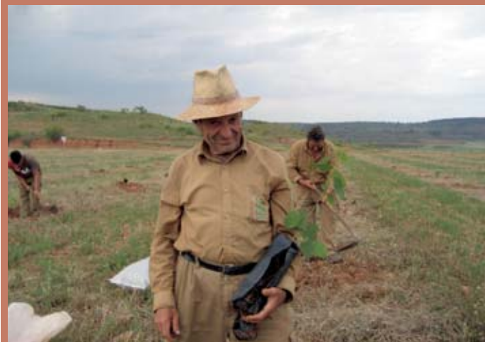
El lugar escogido es la Sierra de Segura en la cabecera del Guadalquivir junto al Guadalmena y el Horcajo