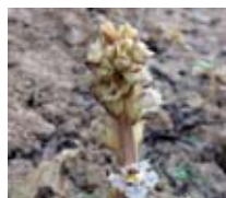
La orobanche es una planta parásita que suele acompañar al cultivo de habas