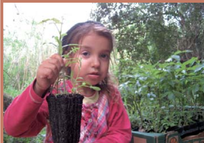
El bosque MamaTerra empieza a ser una realidad