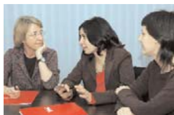
Firma del convenio entre la As. Vida Sana y la Universitat de Vic

Para más información: Secretaría de Formación Continuada Edificio F, planta baja, C. Sagrada Família, 7. 08500 Vic Tel. 93 881 55 16 sfc@uvic.cat