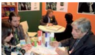
Cada oveja con su pareja...