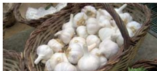
Ajos y melocotones, una buena asociación

Uno de los principales problemas de los melocotoneros es la lepra, hongo que deforma las hojas y reduce su capacidad de hacer la fotosíntesis. Si tenemos un melocotonero tenemos la opción de plantar los ajos bajo el árbol. Parece ser que los "efluvios" azufrados de la planta dificultan la germinación de las esporas del hongo que pasa el invierno en las ramas esperando que broten las hojas.