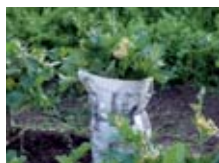
Si envolvemos el apio, se reblandece y es más apetitoso y lo protegemos, de paso, contra las heladas...

El huerto ofrece múltiples posibilidades de reciclaje y reutilización. El papel de diario nos puede ser muy útil durante el invierno para proteger a las plantas frente a heladas importantes. En el caso del apio, además nos ayuda a blanquear, obteniendo una planta más tierna y adecuada para preparar ensaladas. Aunque cada vez resulta más difícil encontrarlas, es mejor utilizar páginas no impresas a color puesto que la tinta a color contiene metales pesados.