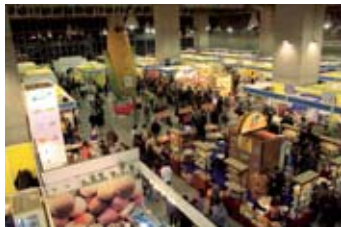
La última edición de BioCultura en Madrid volvió a ser un éxito en todos los sentidos...

Las empresas de alimentación desean poder atender a un público más profesional, pero al mismo tiempo saben que hay todavía pendiente mucha labor de difusión y de llegar al consumidor de forma directa: Y saben, claro, que la feria es un buen instrumento.