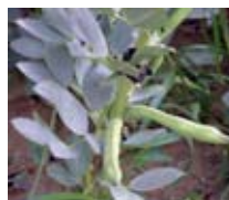
Nódulos de las habas donde se albergan las bacterias fijadoras de nitrógeno

tivo de las habas permite descubrir dos interesantes fenómenos: la simbiosis (la unión de dos organismos para obtener un beneficio mutuo), representada en los nódulos presentes en sus raíces donde las bacterias le proporcionan nitrógeno a cambio de azúcar; y el parasitismo (uno de los organismos saca un provecho a costa de perjudicar al otro), representado por la orobanche, planta parásita que se alimenta directamente de la savia de las habas.