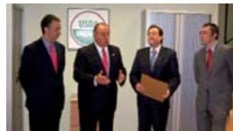
Entrega del NOP en Logroño...

En Europa, los últimos datos estadísticos de que dispone el Ministerio de Agricultura, Pesca y Alimentación indican que existen unas 150.000 empresas certificadas como ecológicas o en fase de conversión a la producción ecológica. Actualmente, España dispone de una superficie agraria de explotación ecológica de más