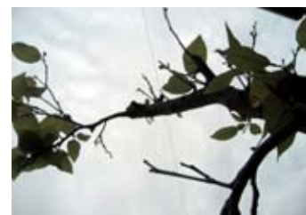
Es mejor podar los árboles en invierno