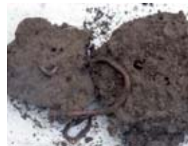
La lombriz de tierra destruye esporas de hongos...

Todo el mundo conoce ya los grandes beneficios que las lombrices de tierra aportan al suelo. Pero la lombriz realiza, además, una labor muy importante de destrucción de esporas de hongos patógenos durante el invierno mientras no se producen heladas. Las hojas enfermas y caídas al suelo son arrastradas dentro del suelo y digeridas por las lombrices disminuyendo así los focos de contaminación en la primavera siguiente.